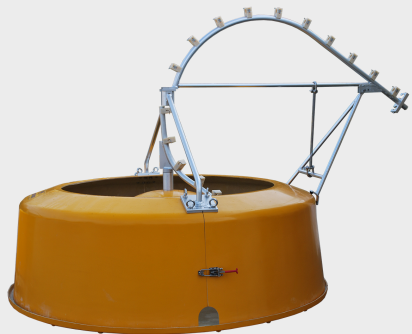
Figaro / Figarino, zwischenlagerung von Kabeln, ersetzt das 8-er Schlaufenlegen