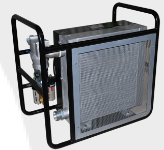
Luftkühler um die Jetting-Leistung zu erhöhen, wenn die Umgebungstemperatur über 20°C ist