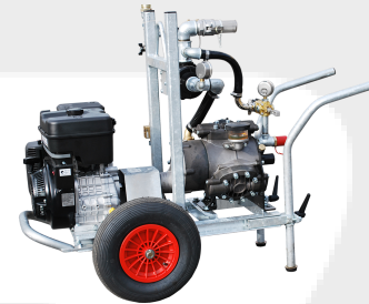
Hydrocab-080, Zubehör für die Kabelverlegung mit Wasser (Einschwemmen), 80 l/Min.