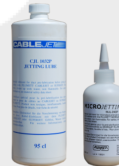
Jetting Lube / Micro Jetting Lube, Schmiermittel das die Einblasleistung verbessert