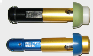
Schallkopf, für das Einblasen von Kabeln mit geringer Steifheit